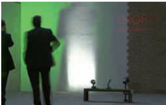
Nello spazio del Giardino l'isola Disegnare la luce: prove di luce sulle sue quinte luminose di materiali diversi.

Nella "piazza" vediamo in funzione apparecchi su palo per l'arredo urbano con anche altre tecnologie a livello di sorgenti luminose unitamente alle giuste ottiche, che ci danno ottimi risultati, ad esempio le ioduri metallici a luce calda e le fluorescenti compatte; ci sono situazioni in cui non possiamo fare a meno del LED, ad esempio nell'integrazione con l'architettura, nell'uso del colore, che è molto saturo, efficace, quando il progetto presenta difficoltà di manutenzione per cui l'apparecchio